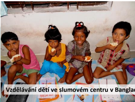
Vzdělávání dětí ve slumovém centru v Bangladéši