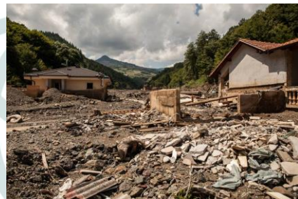
Následky povodní na Balkáně