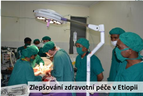
Zlepšování zdravotní péče v Etiopii