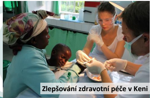
Zlepšování zdravotní péče v Keni