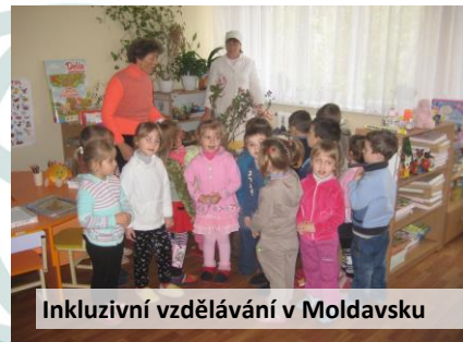
Inkluzivní vzdělávání v Moldavsku