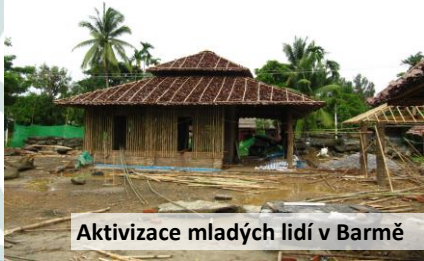
Aktivizace mladých lidí v Barmě