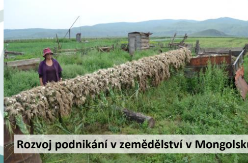
Rozvoj podnikání v zemědělství v Mongolsku