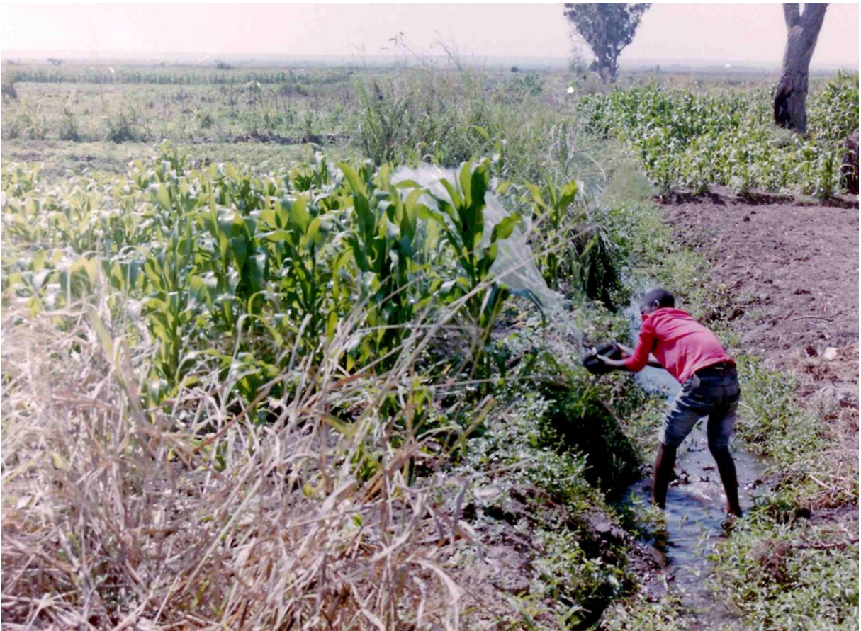
Farmáři v Chipulukusu (jedna z chudinských čtvrtí ve Ndole) mají na rozdíl od ostatních částí Ndoly dostatek vody po celý rok a proto mohou pěstovat kukuřici i v období sucha. Díky důmyslnému systému uměle vytvořených struh a potoků nejsou závlahy až tak obtížné.