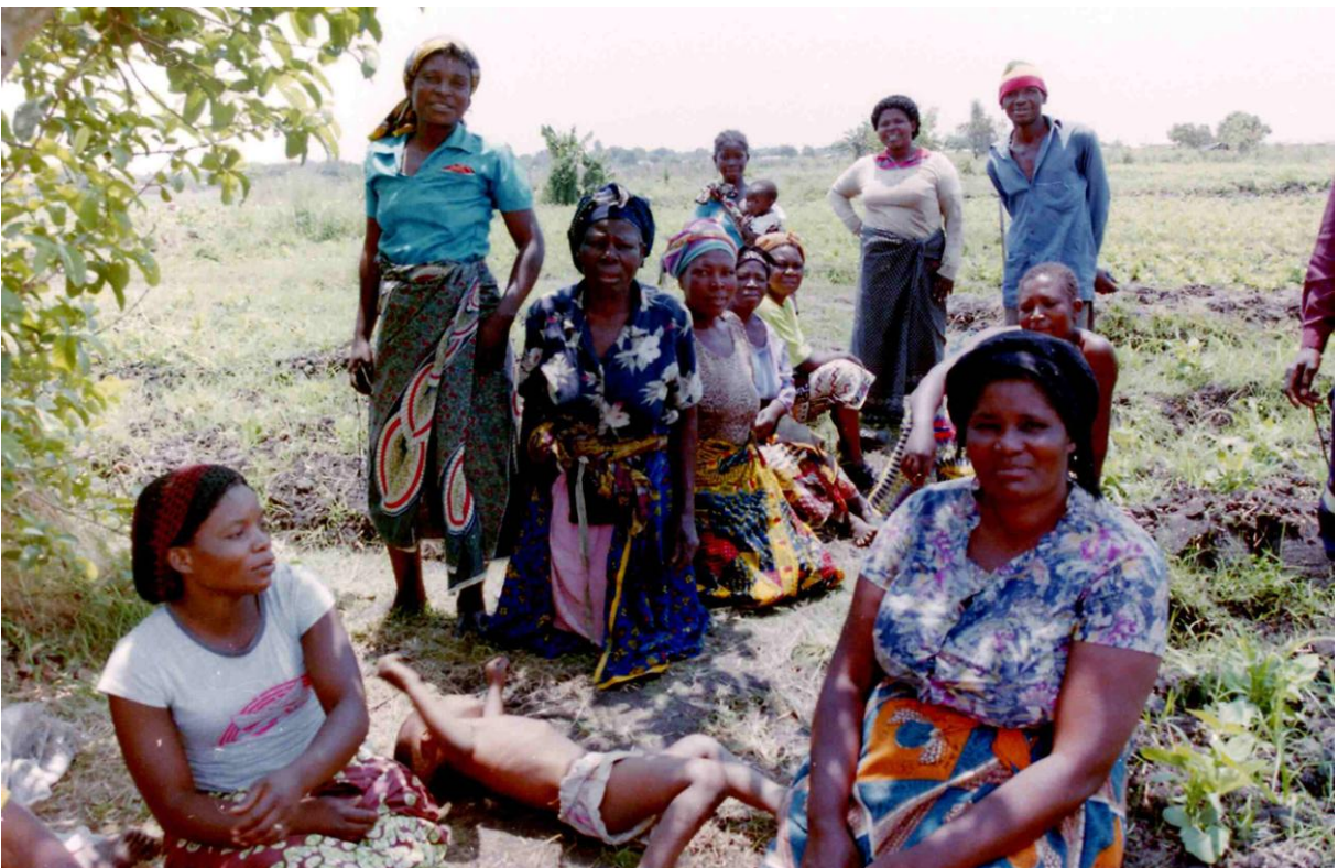
Ženy – farmářky z komunity, které se taktěž účastnily skupinové diskuse.