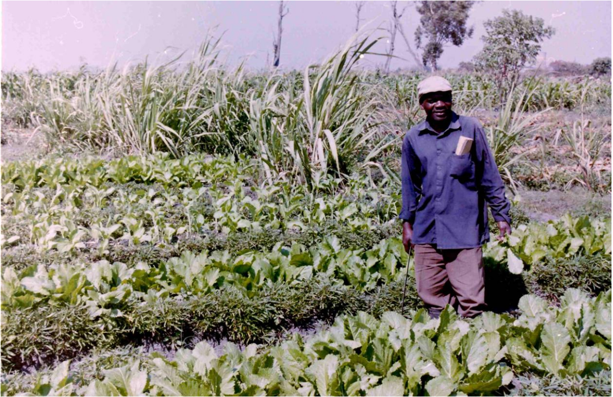
Jeden z farmářů ukazuje jeho pole – pěstuje zde zároveň čínské zelí a amarant.