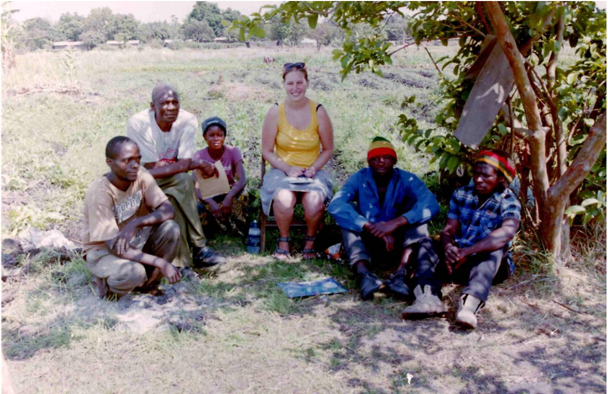
Po skupinové diskuzi s farmáři.